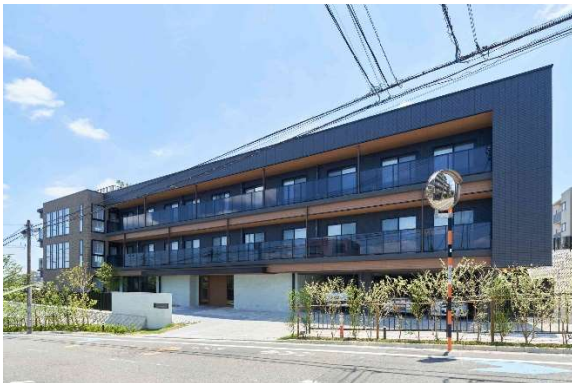
アズハイム大田中央 外観

また、当該地は、小高い丘に位置し各階に設置されているリビング・ダイニングからの眺望も楽しむことができ、陽当たりも良好なロケーションです。